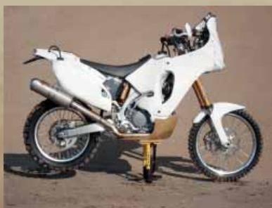
Exemples de motos décorées

3. Soyez partenaires (10 recherchés) - Participation : 5.000 €